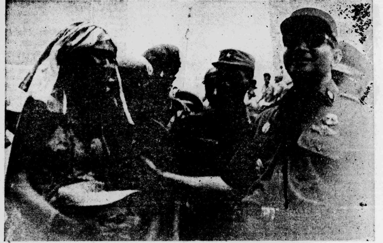
Gbr. Atas: Panglima Kolonas Djendral Soeharto sedang beramah tamah sedjenak dengan buruh pelabahan. (Foto AB/Basir).